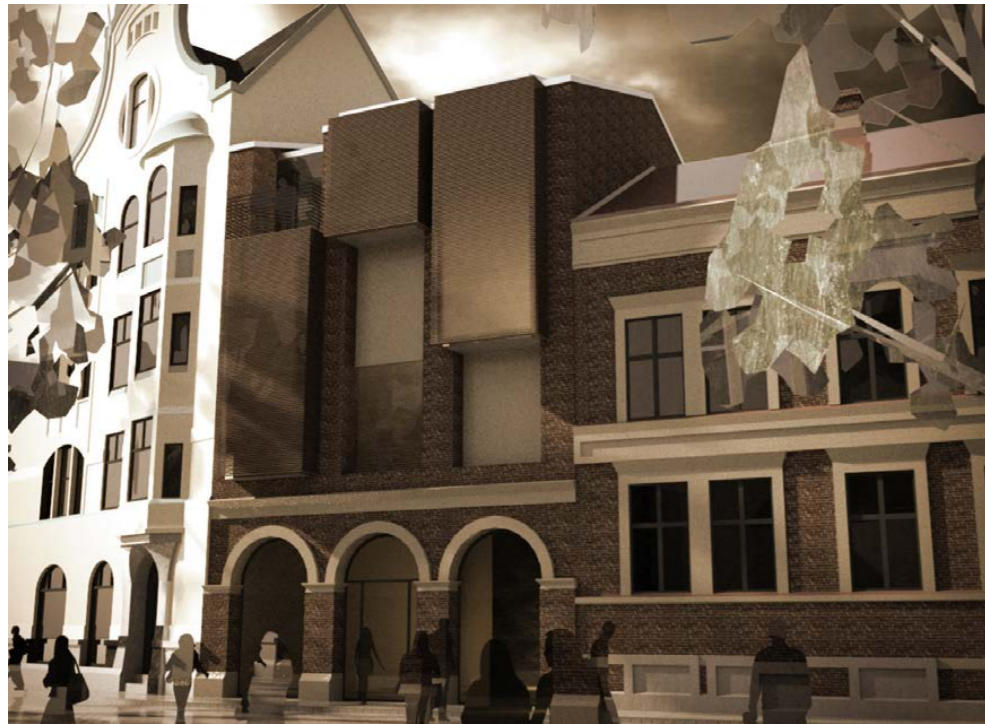
Mitt förslag tar upp vertikaliteten och tredelningen från underliggande byggnad

“Vid Bantorgetets södra sida ligger en restaurang inrymd i en envåningsbyggnad som tiden tycks ha passerat förbi. En exploatör har upptäckt det attraktiva läget och önskar få kommunens tillstånd att bygga på envåningsbyggnaden med 2-3 nya plan mot avgränsande gavelbyggnader. Du har åtagit dig att pröva förutsättningarna och skall ge en skiss på hur en ny volym ovanpå byggnaden ska gestaltas.”