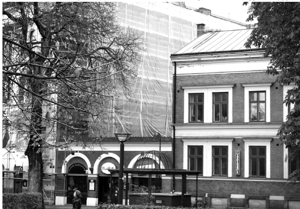
Restaurang på bantorget innan påbyggnad